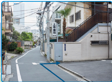
P1方向から見たイメージ